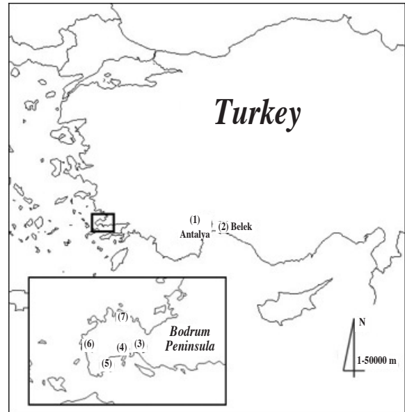
Şekil 1. Araştırmaya alınan Antalya (1), Belek sahil şeridi (2) ve Bodrum yarımadasında (3-7) örnekleme yapılan bölgeler.

Araştırmaya, Antalya şehir merkezi, Belek turizm sahil şeridi ve Bodrum yarımadasında turizm aktivitelerinin yoğun olduğu bölgelerde yaygın olarak bulunan üzerinde kovuk bulunan 201 ilgın ( Tamarix sp. ) ağacı alındı (Şekil 1). Ağaçların kovuk ve çevrelerinde güvercin çıkartmaları ve yoğun organik kirlenme varlığı saptanması durumunda o ağaç araştırmaya alınmadı. Bu aşamada tür tanımlaması yapılmadı.